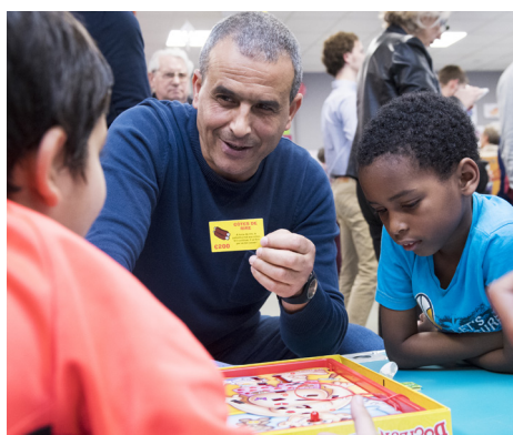
© Aldo Sperber - CNP Assurances

En 2017, BSF a développé sa première Ideas Box thématique dans la communauté d'agglomération du Boulonnais : l'Ideas Box Santé - CNP Assurances. Celle-ci favorise la mise en place d'activités de prévention santé auprès des enfants, adolescents et jeunes adultes. En proposant des contenus adaptés, elle leur permet de mieux comprendre et gérer les bouleversements physiques et émotionnels qu'ils vivent au quotidien, des addictions aux relations sexuelles. Des ateliers les mettent également en situation de créateurs de contenus (vidéos, pièces de théâtre), diffusés ensuite auprès de leurs camarades. En 2019, c'est la ville de Sarcelles qui accueille la deuxième Ideas Box Prévention Santé.